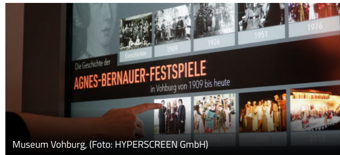
Museum Vohburg

Mehr Infos und Anmeldung auf museum-vohburg.de und unter 08457 9359646