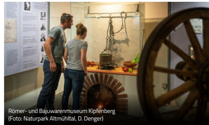
Römer- und Bajuwarenmuseum Kipfenberg

Mehr Infos und Anmeldung auf bajuwaren-kipfenberg.de und unter 08465 905707