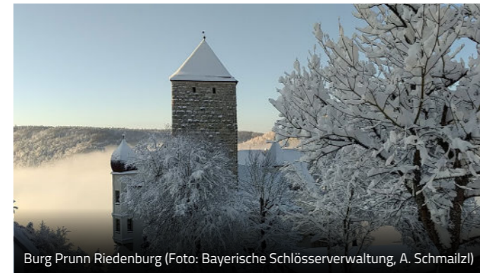
Burg Prunn Riedenburg