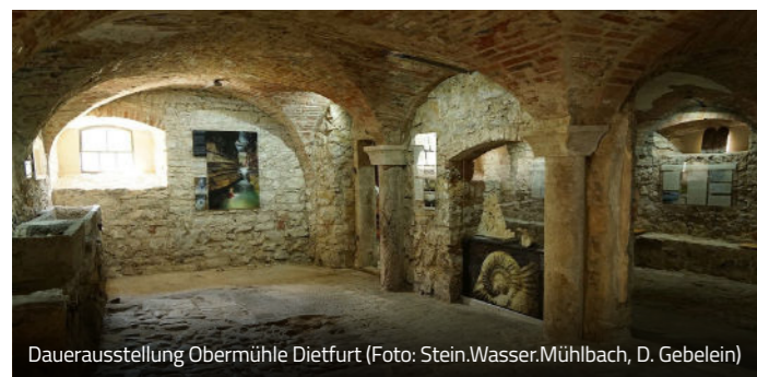
Dauerausstellung Obermühle Dietfurt