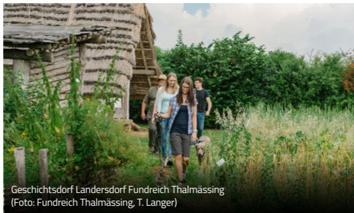
Geschichtsdorf Landersdorf Fundreich Thalmässing