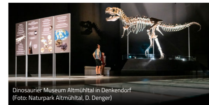
Dinosaurier Museum Altmühltal in Denkendorf