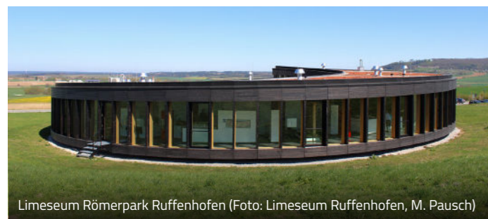
Limeseum Römerpark Ruffenhofen