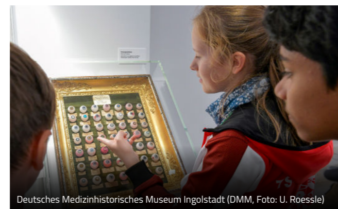
Deutsches Medizinhistorisches Museum Ingolstadt (DMM)