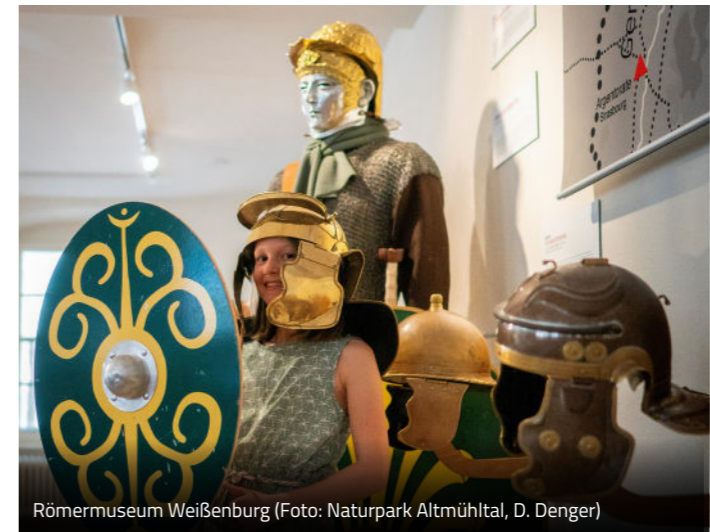
Römermuseum Weißenburg