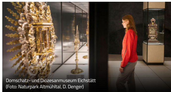
Domschatz- und Diözesanmuseum Eichstätt